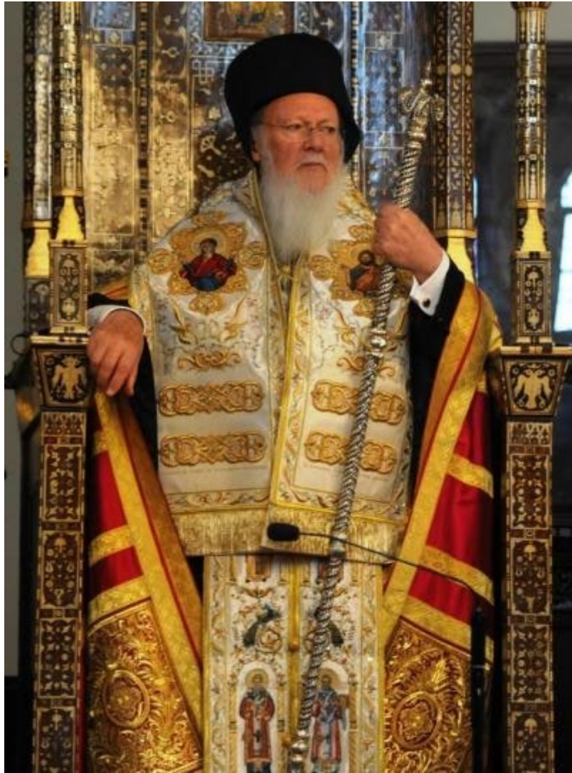
SUA SANTITA' BARTOLOMEO I PATRIARCA ECUMENICO